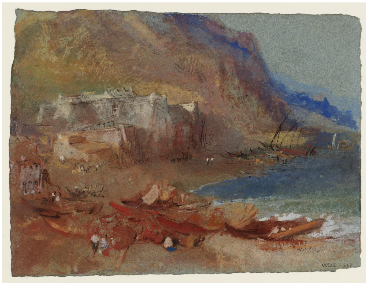
Fig.1 : William Turner, « Riviera » (gouache rehaussée à la plume, sur papier bleu, 14,2 x 19,2cm) (The Priamar Fortress at Savona, c.1828-37 Turner Bequest CCLIX 140, D24705).

Une des plus intéressantes gouaches peintes par Turner sur la Riviera méditerranéenne du royaume de Piémont-Sardaigne (aujourd'hui département français des Alpes Maritimes et province italienne de Ligurie) est celle qui est connue aujourd'hui dans le catalogue de la Tate gallery sous le titre : « Riviera ».