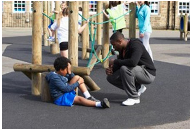
Relation enseignant-élèves positive