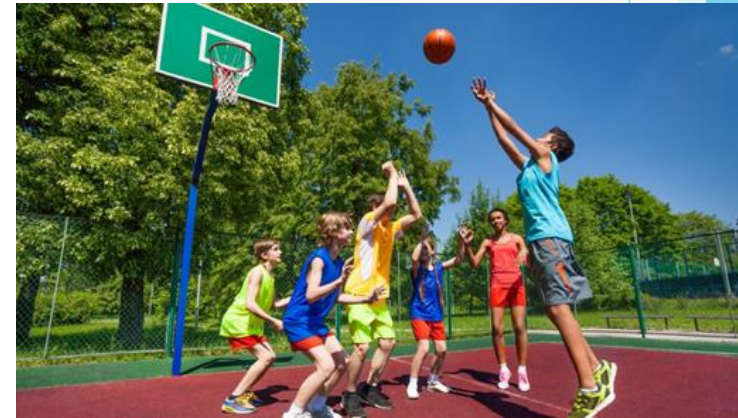
Amélioration des résultats scolaires & du comportement des élèves