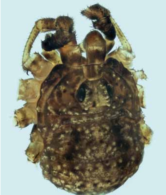
Figure 2.- Kalliste pavonum : vue rapprochée de habitus du mâle adulte, sans patte.

les femelles) qui fait de Kalliste pavonum le plus petit Phalangiidae connu à ce jour (MARTENS, 2018). Ce qui explique aussi, peut-être, la tardive découverte de cette espèce qui a pu être confondue avec des juvéniles.