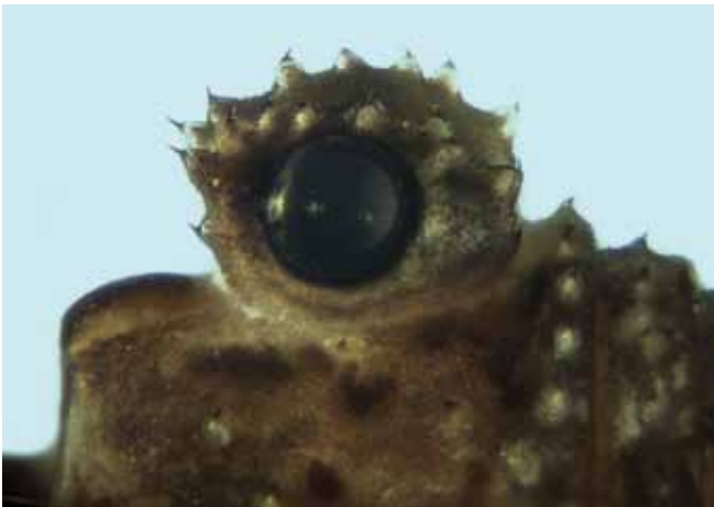
Figure 3.- Kalliste pavonum : vue de profil de l'ocularium du mâle adulte.

Un second critère est l'ocularium assez imposant (fig. 3), représentant plus de la moitié de la longueur du prosoma.