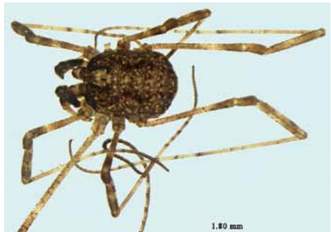
Figure 1.- Kalliste pavonum : habitus du mâle adulte.

L'un des premiers critères est la très faible taille (1,8 à 2,0 mm chez les mâles (fig. 1 et 2) et 1,9 à 2,6 mm chez