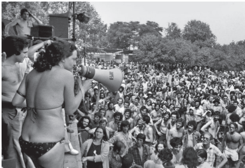
Fig. 1 - DINO FRACCHIA, Ragazza sul palco , festival del Proletariato Giovanile, Parco Lambro, 1976