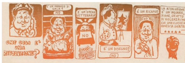
Fig. 5 - Mao e la rivoluzione, «Re Nudo», 1971, 1