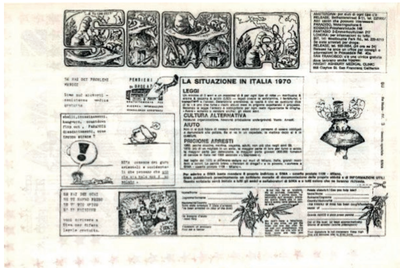
Fig. 3 - SIMA (Servizi Istituto Massa Media Art), 1970