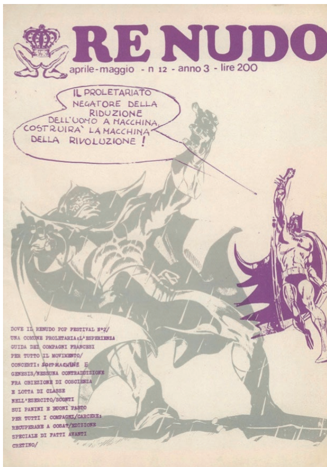
Fig. 4 - «Re Nudo», 1972, 12