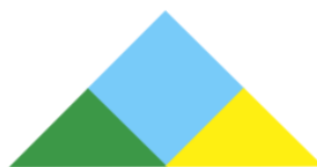
Figure 3 – La figure modèle donnée aux élèves

Le problème posé aux élèves est le suivant : Reproduire la figure modèle (figure 3) par pliage effectif du PLIOX. Après une discussion collective portant sur une première analyse de la figure modèle, la résolution du problème est réalisée individuellement. La séance se poursuit par une mise en commun des procédures et se conclut par une synthèse.