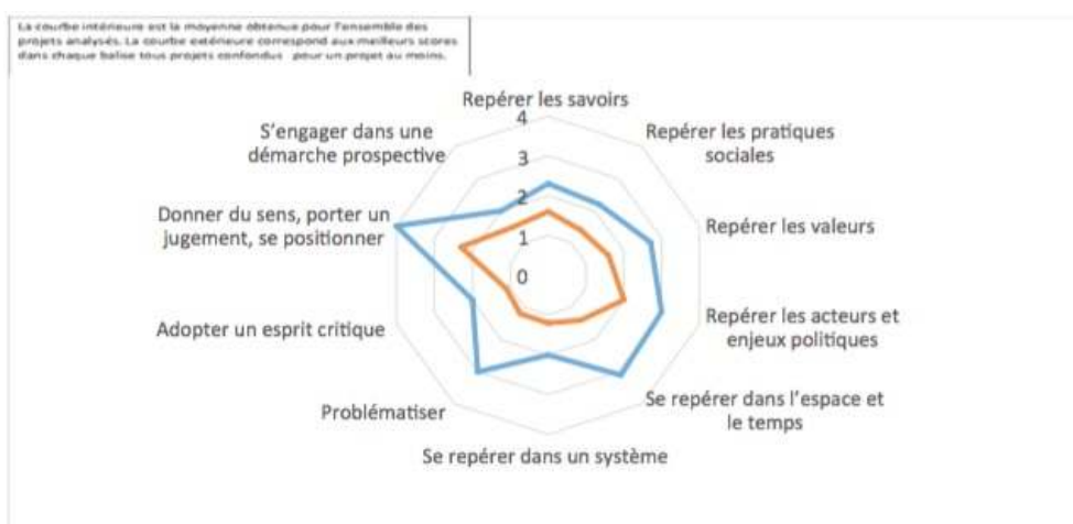
Tableau 4 – Radar représentant le niveau atteint par les 88 projets de prospective territoriale (Graphite, 2017)