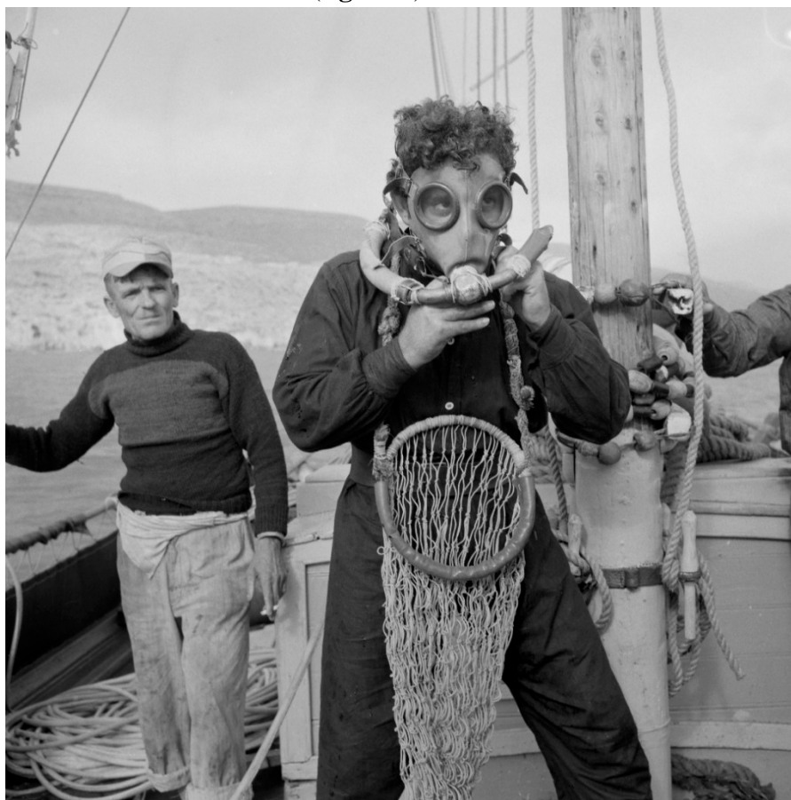
Figure 2 Modèle d'appareil Fernez II postérieur à la Seconde Guerre mondiale.

caoutchouc, tandis qu'un pince-narines obture la partie supérieure de ses voies respiratoires 8 . Un masque, intégrant des verres de vision et l'embout d'alimentation et d'évacuation de l'air équipe enfin les modèles les plus tardifs du Fernez II, tels qu'ils sont utilisés après la Seconde Guerre mondiale ( figure 2 ).