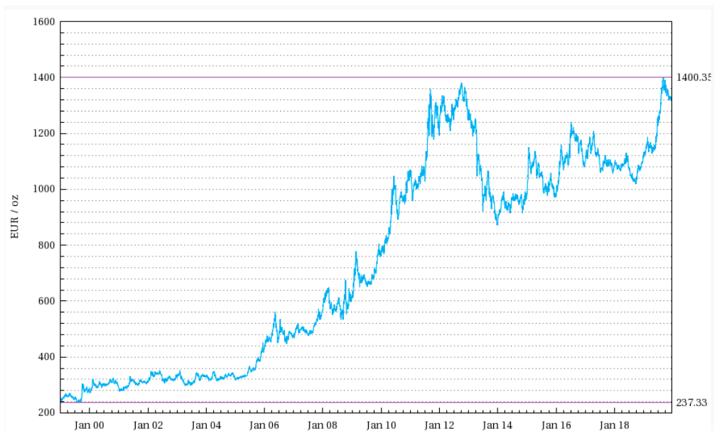
Figure 3. Prix en euros d’une once d’or (1996-2019)

Sources : http://www.lbma.org.uk/precious-metal-prices