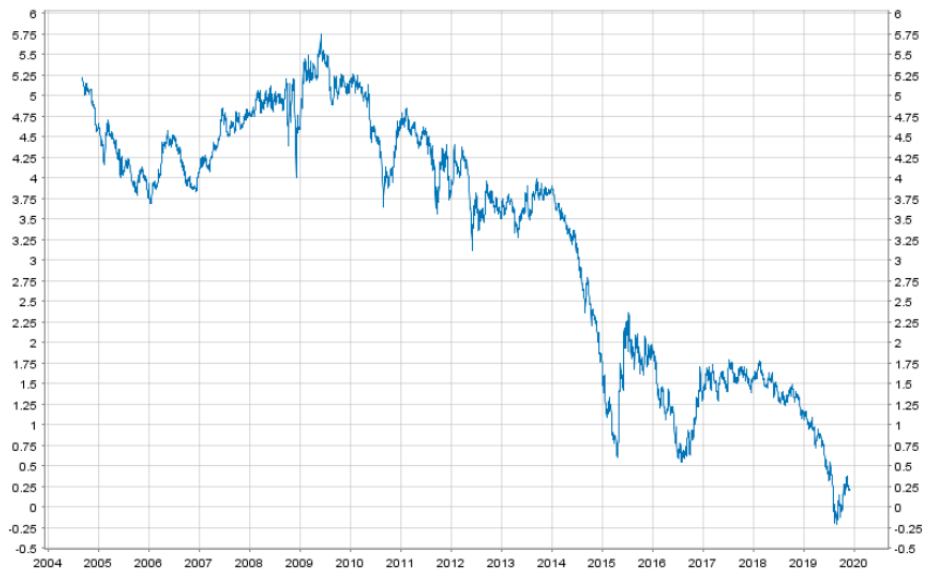
Figure 2. Taux d'intérêt sur les obligations d'Etat à 10 ans