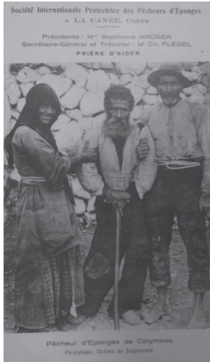
Figure 3 : Carte éditée par la Société internationale de protection des pêcheurs d'éponges, 1911 (bibliothèque du musée océanographique de Monaco, correspondance de Charles Flegel avec le prince de Monaco).